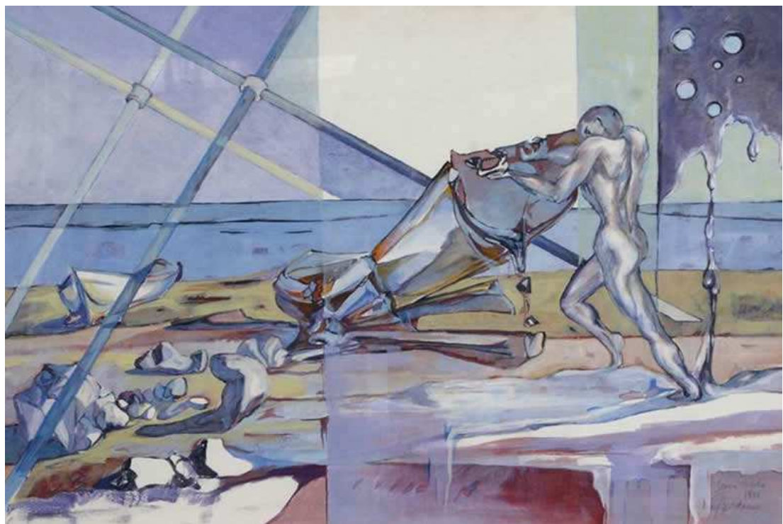
- Angela Giordano – SENZA TITOLO –