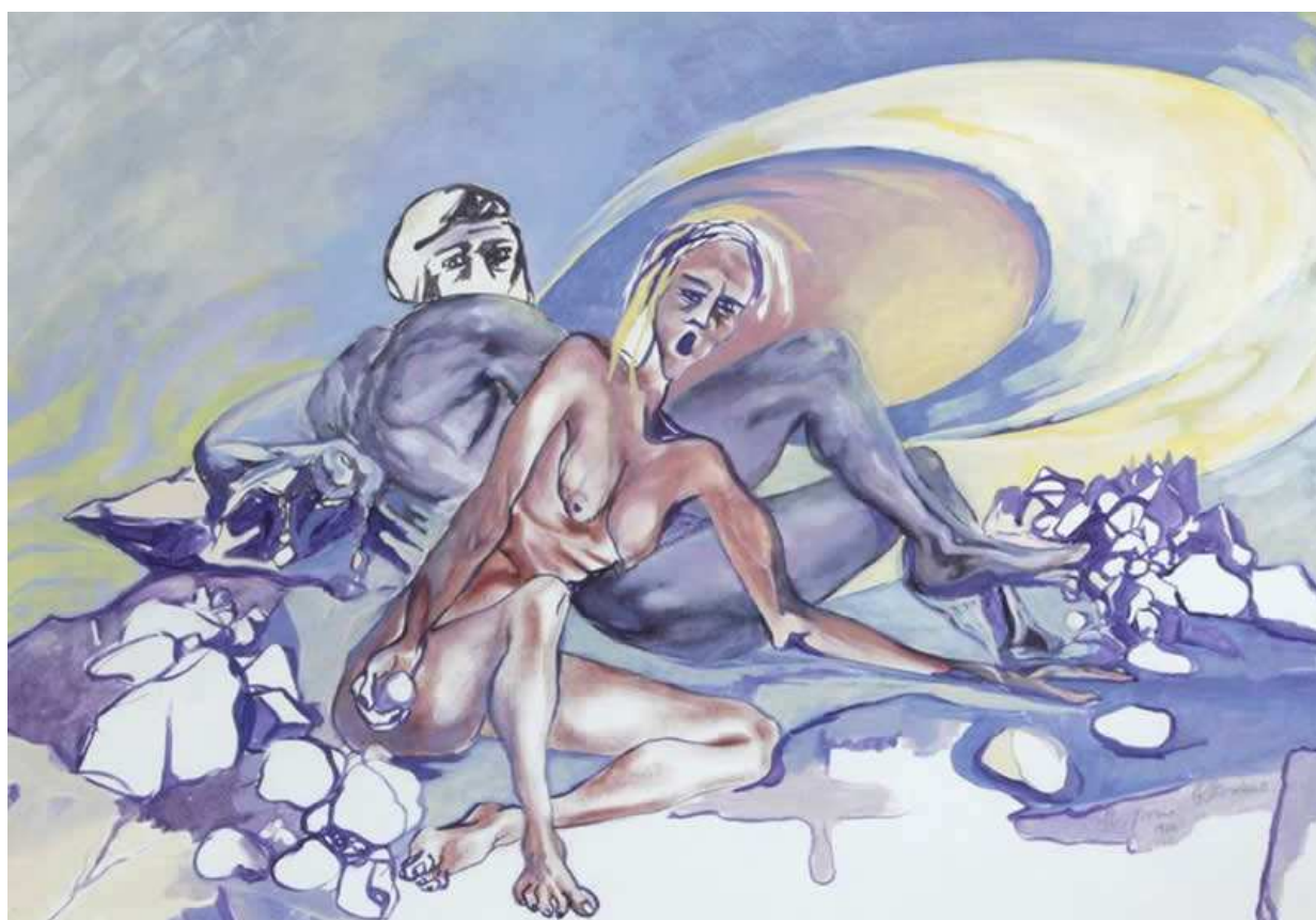
- Angela Giordano - IL GIORNO 1988 -