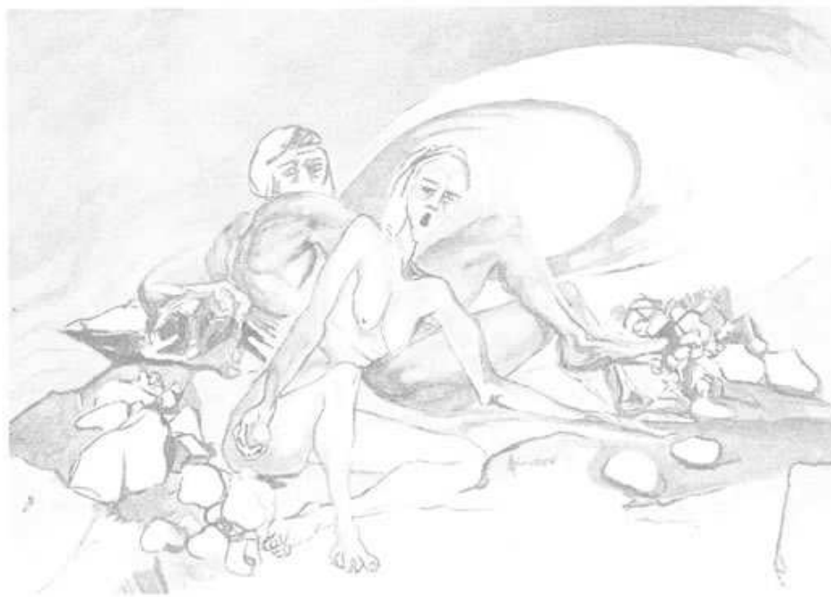
«H. GIORNO 1988», cm. 70x50, acrilico su tela