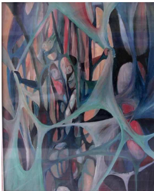
- Angela Giordano–SENZA TITOLO-